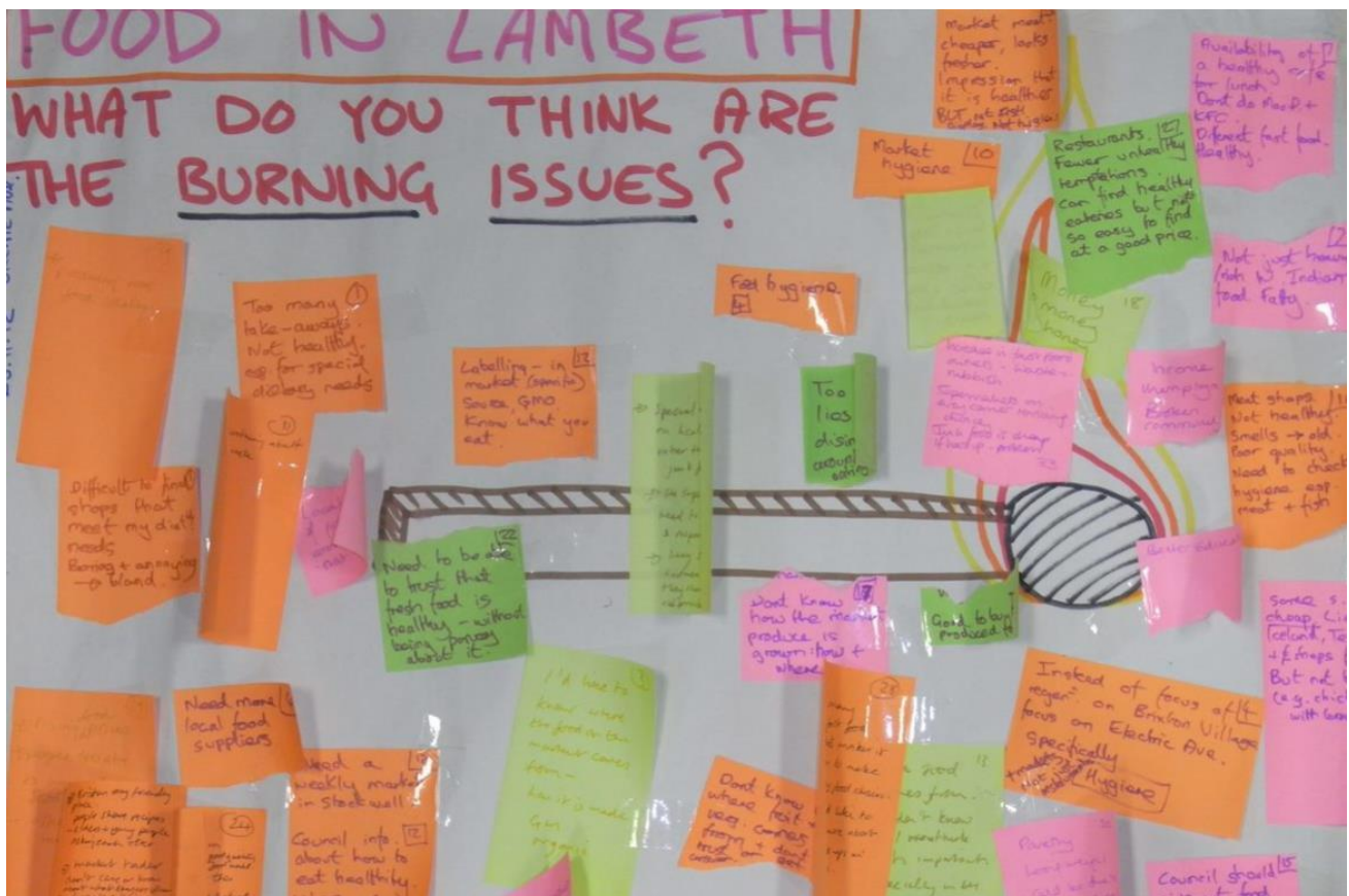
Siart Pynciau Llosg o Fapio Bwyd Cymunedol Lambeth