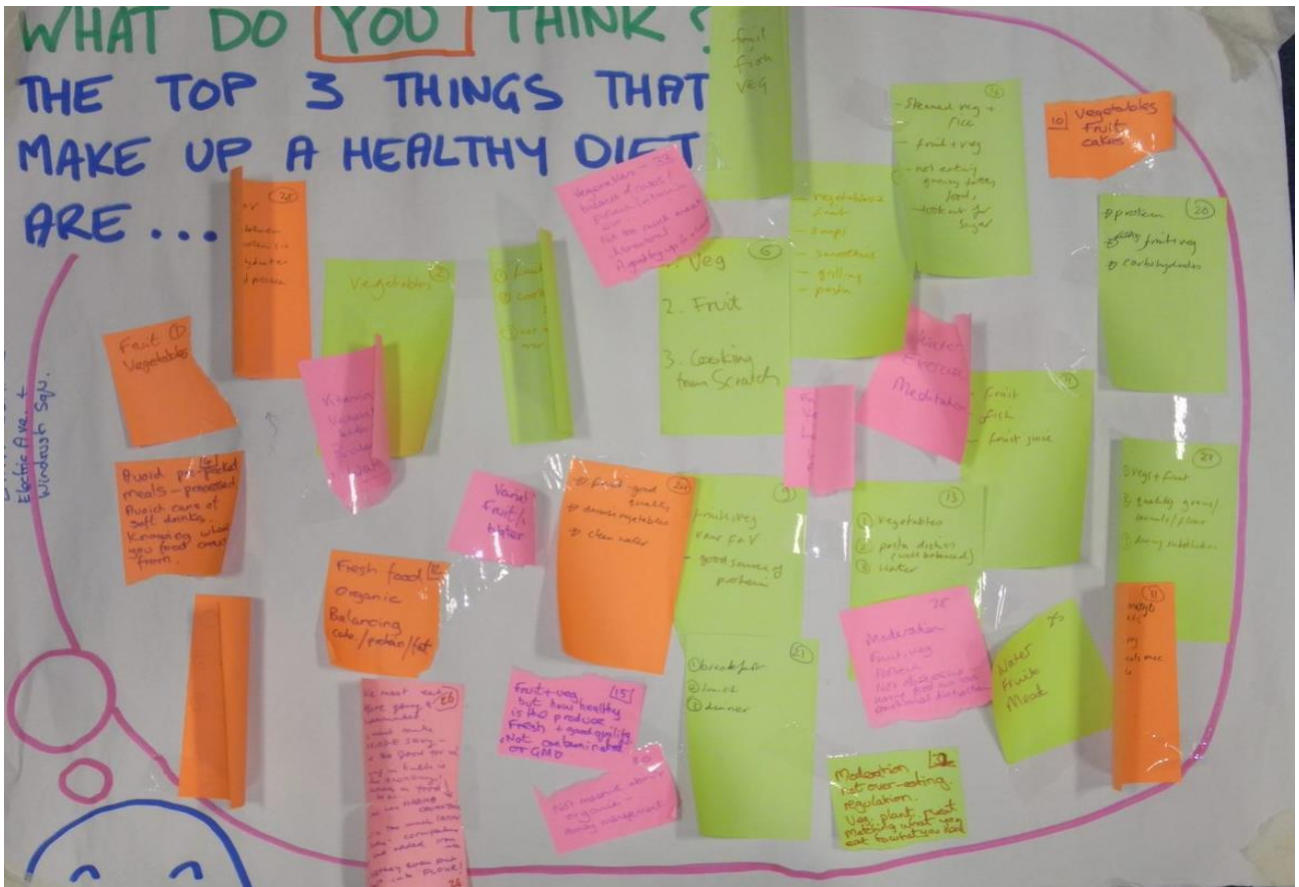
Siart 3 Peth Pwysicaf o Fapio Bwyd Cymunedol Lambeth