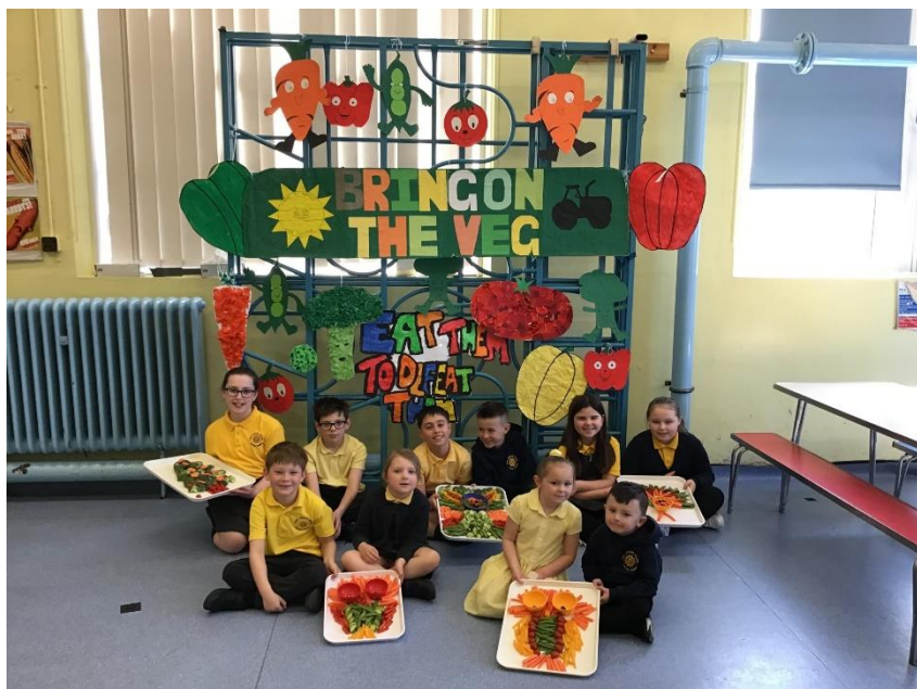
Ysgol Cynfran yn Llysfaen yng Nghonwy Ysgol Gynradd Ffaldau ym Mhontycymer, Pen-y-bont ar Ogwr